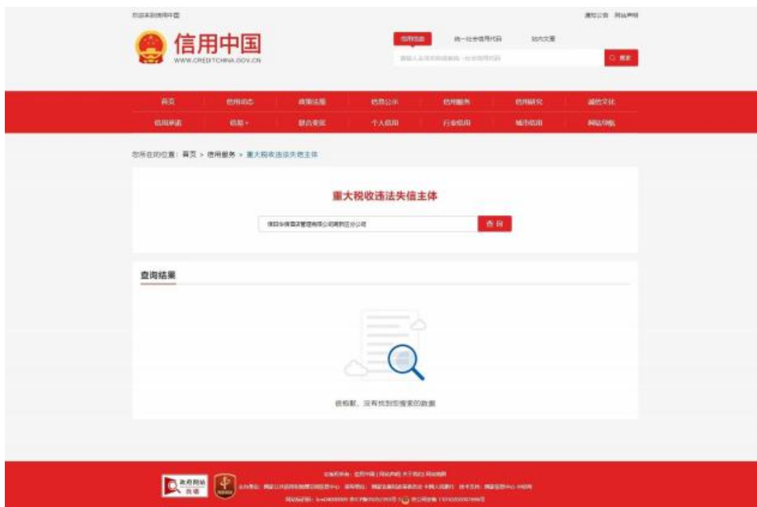
(3) “信用中国” 政府采购严重违法失信行为记录名单截图