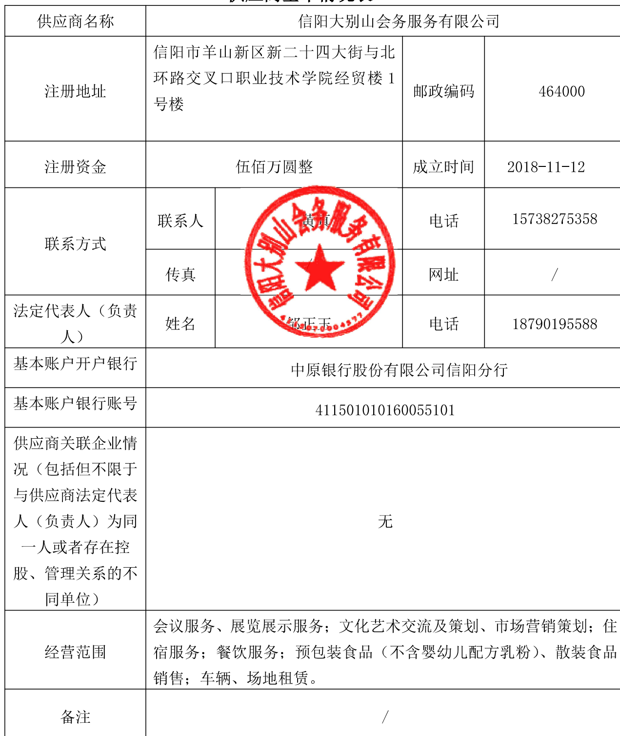
供应商基本情况表