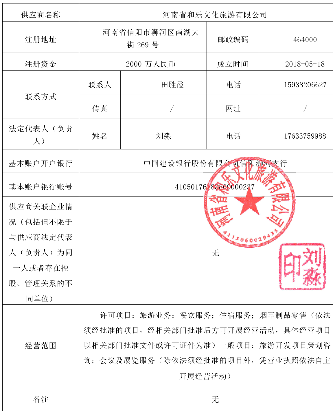
供应商基本情况表